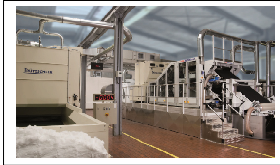
Carda Random, p.ej.: para productos higiénicos

Fibras: 0.7 – 30 dtex Longitud de fibra: 15 a 60 mm Peso del velo: 25 – 140 g/m 2 Producción: ≤ 400 kg/h/m Ancho de trabajo: < 3,800 mm